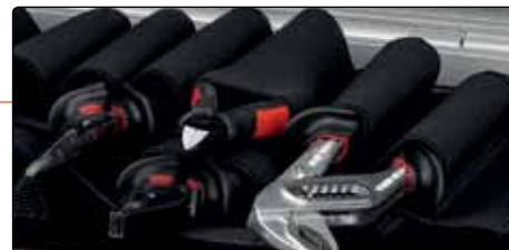
Закрепване на инструмента с уши