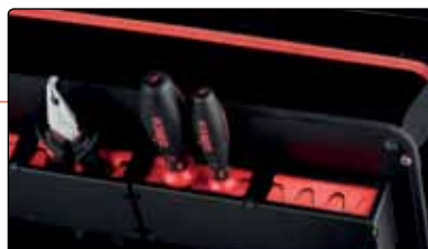
Закрепване на инструмента с ламели

Инструменталните джобове са оборудвани с еластичен материал и интелигентни задържащи системи. Двата варианта са отворени в долната си област, като по този начин подsigуряват захващането на поидълги инструменти и отвертки.